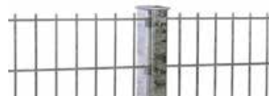
RANKO Profilschienenpfahl laut GUVV