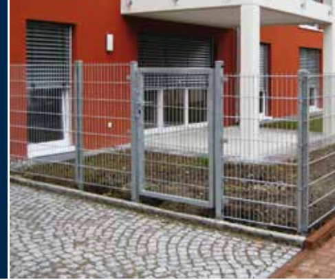
Profilschienenpfahl lt. GUVV