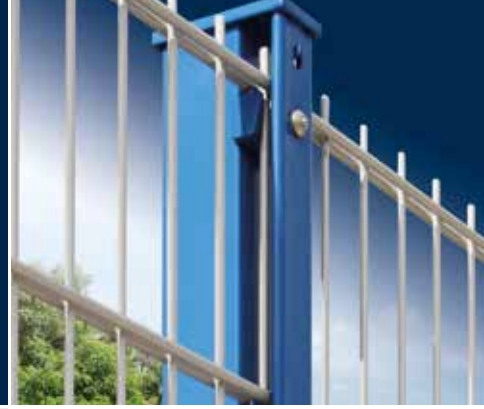
Stahl-Abdeckschiene mit Montagehilfe